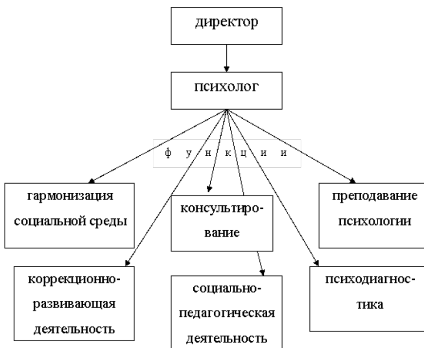
Рис. 1. Структура психологической службы