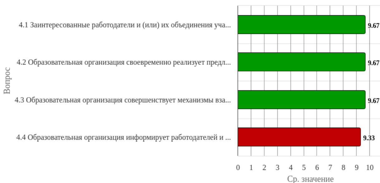
Рисунок 1.4 - Распределение показателей уровня удовлетворённости респондентов по блоку вопросов «Функционирование внутренней системы оценки качества образования»

Индекс удовлетворённости по блоку вопросов «Функционирование внутренней системы оценки качества образования» равен 9.58.