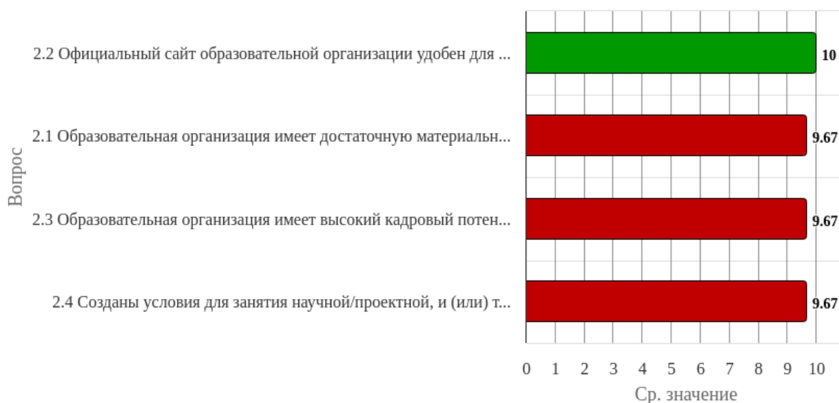
Рисунок 1.2 - Распределение показателей уровня удовлетворённости респондентов по блоку вопросов «Оценка условий реализации образовательной программы»

Индекс удовлетворённости по блоку вопросов «Оценка условий реализации образовательной программы» равен 9.75.