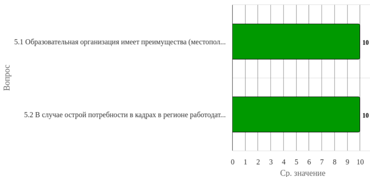
Рисунок 1.5 - Распределение показателей уровня удовлетворённости респондентов по блоку вопросов «Репутационные характеристики»

Индекс удовлетворённости по блоку вопросов «Репутационные характеристики» равен 10.