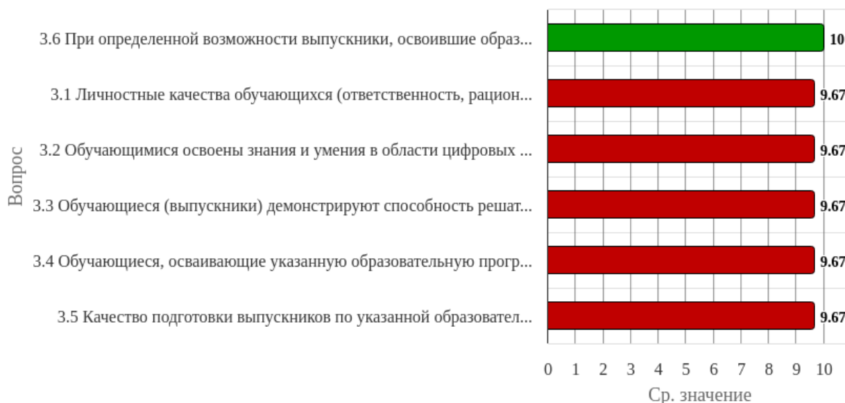
Рисунок 1.3 - Распределение показателей уровня удовлетворённости респондентов по блоку вопросов «Оценка качества подготовки обучающихся (выпускников)»

Индекс удовлетворённости по блоку вопросов «Оценка качества подготовки обучающихся (выпускников)» равен 9.72.