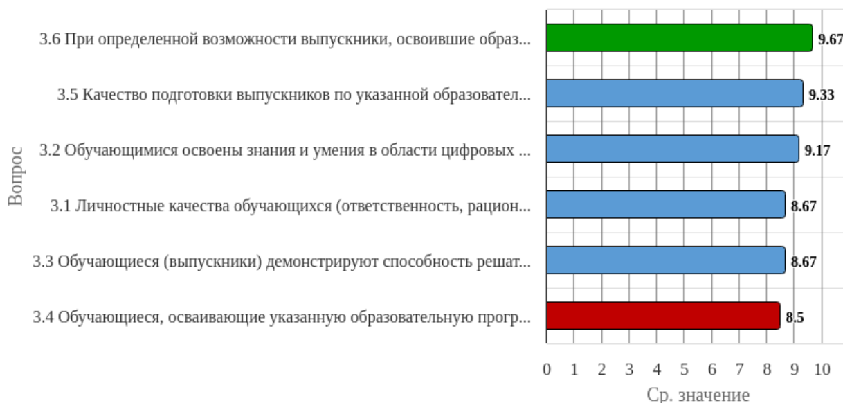
Рисунок 1.3 - Распределение показателей уровня удовлетворённости респондентов по блоку вопросов «Оценка качества подготовки обучающихся (выпускников)»

Индекс удовлетворённости по блоку вопросов «Оценка качества подготовки обучающихся (выпускников)» равен 9.