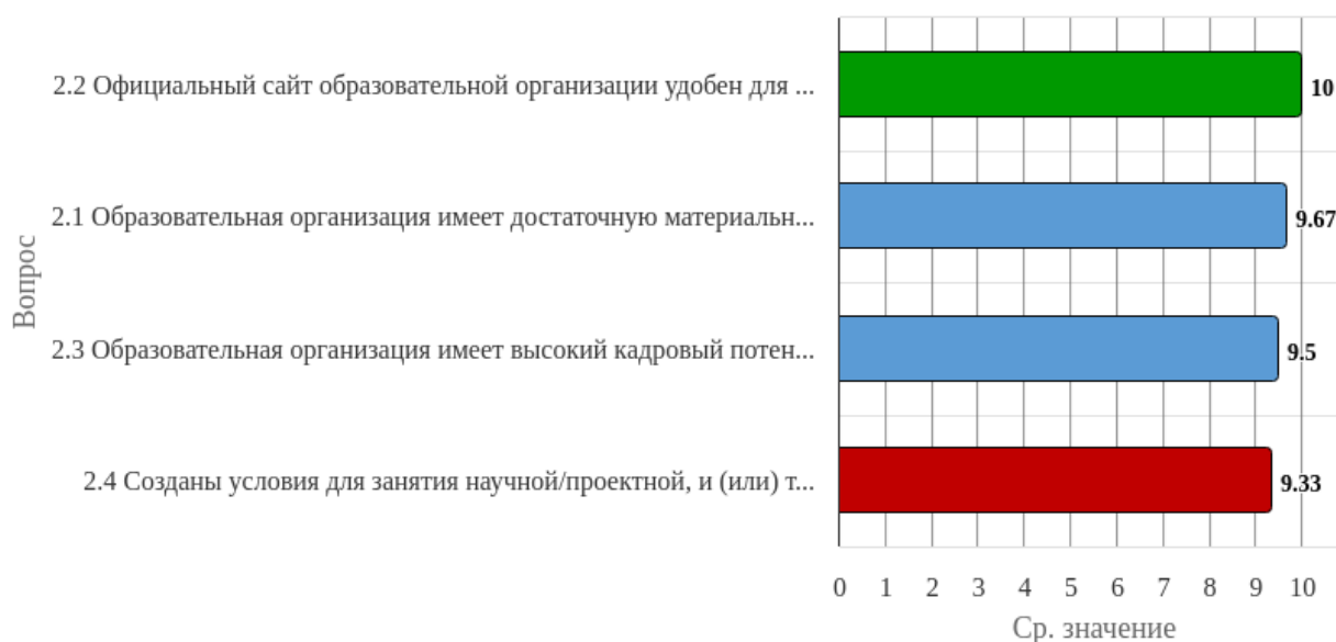
Рисунок 1.2 - Распределение показателей уровня удовлетворённости респондентов по блоку вопросов «Оценка условий реализации образовательной программы»

Индекс удовлетворённости по блоку вопросов «Оценка условий реализации образовательной программы» равен 9.63.