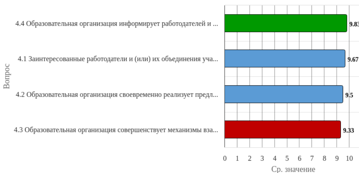
Рисунок 1.4 - Распределение показателей уровня удовлетворённости респондентов по блоку вопросов «Функционирование внутренней системы оценки качества образования»

Индекс удовлетворённости по блоку вопросов «Функционирование внутренней системы оценки качества образования» равен 9.58.