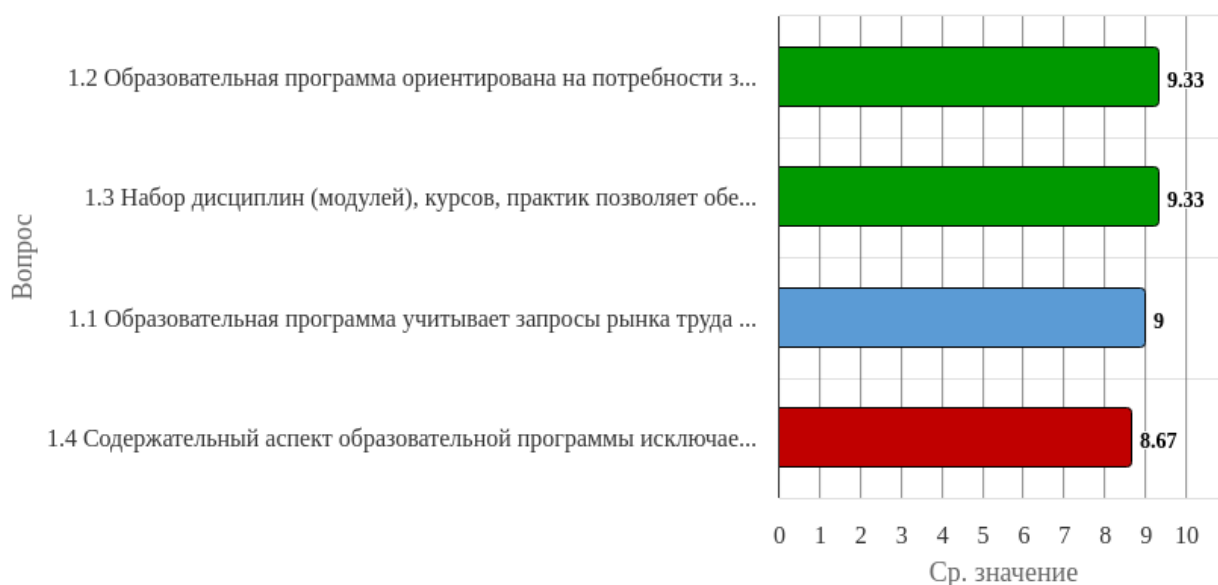
Рисунок 1.1 - Распределение показателей уровня удовлетворённости респондентов по блоку вопросов «Оценка содержания образовательной программы»

Индекс удовлетворённости по блоку вопросов «Оценка содержания образовательной программы» равен 9.08.