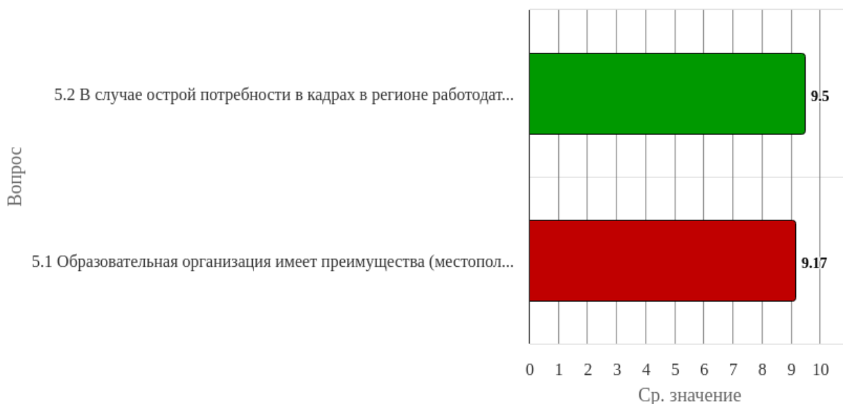
Рисунок 1.5 - Распределение показателей уровня удовлетворённости респондентов по блоку вопросов «Репутационные характеристики»

Индекс удовлетворённости по блоку вопросов «Репутационные характеристики» равен 9.33.