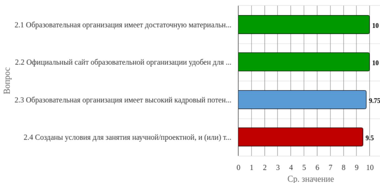
Рисунок 1.2 - Распределение показателей уровня удовлетворённости респондентов по блоку вопросов «Оценка условий реализации образовательной программы»

Индекс удовлетворённости по блоку вопросов «Оценка условий реализации образовательной программы» равен 9.81.