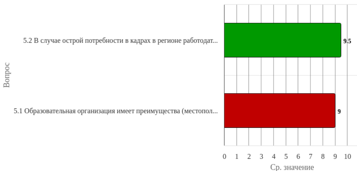
Рисунок 1.5 - Распределение показателей уровня удовлетворённости респондентов по блоку вопросов «Репутационные характеристики»

Индекс удовлетворённости по блоку вопросов «Репутационные характеристики» равен 9.25.