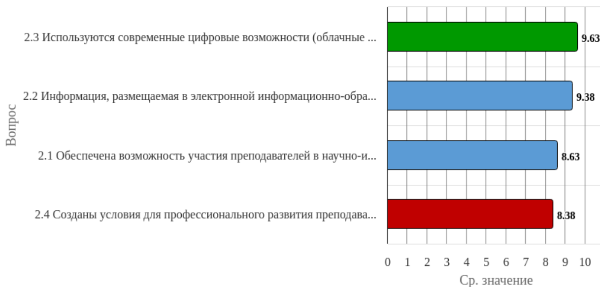
Рисунок 1.2 - Распределение показателей уровня удовлетворённости респондентов по блоку вопросов «Оценка условий реализации образовательной программы»

Индекс удовлетворённости по блоку вопросов «Оценка условий реализации образовательной программы» равен 9.