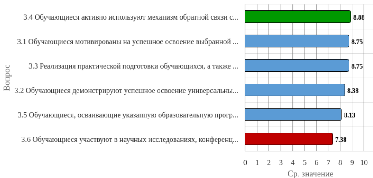
Рисунок 1.3 - Распределение показателей уровня удовлетворённости респондентов по блоку вопросов «Оценка качества подготовки обучающихся (выпускников)»

Индекс удовлетворённости по блоку вопросов «Оценка качества подготовки обучающихся (выпускников)» равен 8.38.