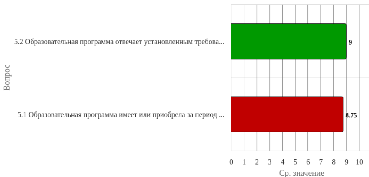
Рисунок 1.5 - Распределение показателей уровня удовлетворённости респондентов по блоку вопросов «Репутационные характеристики»

Индекс удовлетворённости по блоку вопросов «Репутационные характеристики» равен 8.88.