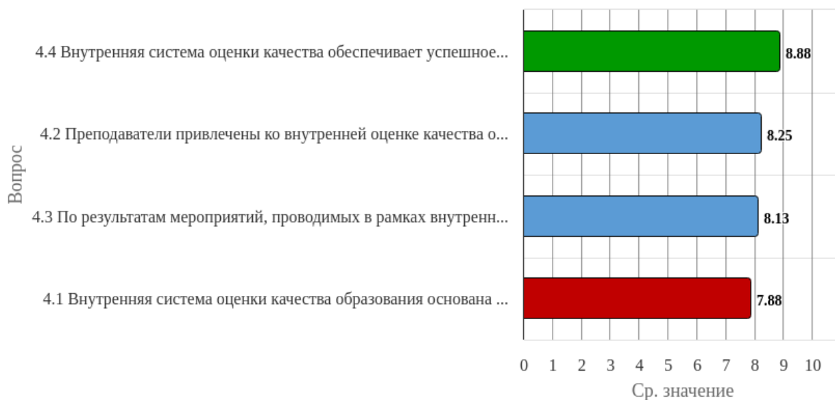
Рисунок 1.4 - Распределение показателей уровня удовлетворённости респондентов по блоку вопросов «Функционирование внутренней системы оценки качества образования»

Индекс удовлетворённости по блоку вопросов «Функционирование внутренней системы оценки качества образования» равен 8.28.