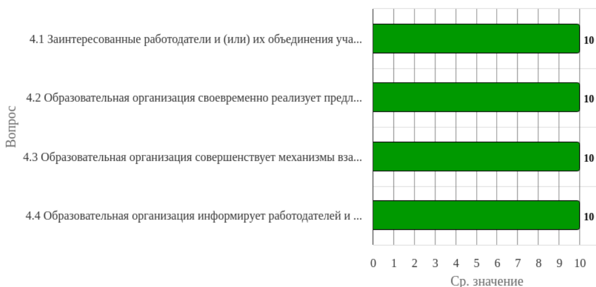
Рисунок 1.4 - Распределение показателей уровня удовлетворённости респондентов по блоку вопросов «Функционирование внутренней системы оценки качества образования»

Индекс удовлетворённости по блоку вопросов «Функционирование внутренней системы оценки качества образования» равен 10.