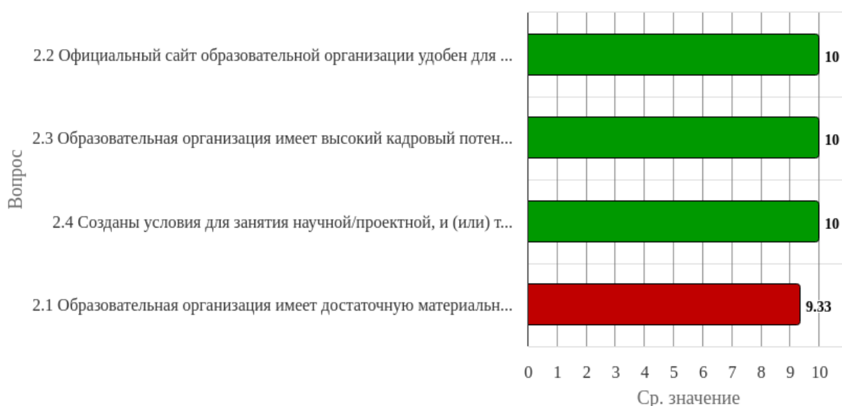
Рисунок 1.2 - Распределение показателей уровня удовлетворённости респондентов по блоку вопросов «Оценка условий реализации образовательной программы»

Индекс удовлетворённости по блоку вопросов «Оценка условий реализации образовательной программы» равен 9.83.