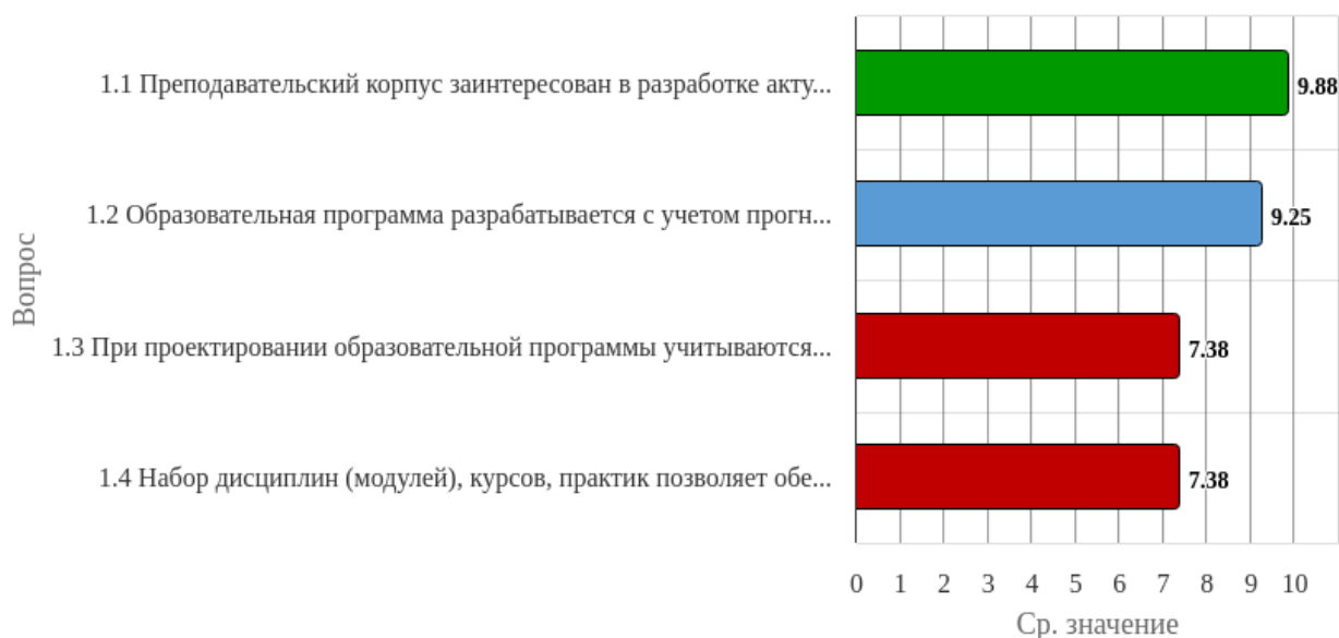
Рисунок 1.1 - Распределение показателей уровня удовлетворённости респондентов по блоку вопросов «Оценка содержания образовательной программы»

Индекс удовлетворённости по блоку вопросов «Оценка содержания образовательной программы» равен 8.47.